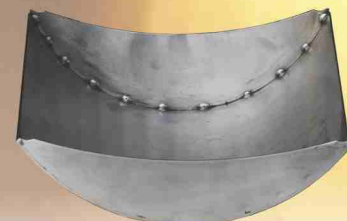
Nerezový žáruvzdorný popelník

Kamna Nemo navíc splňují i ty nejprísnejší emisní limity a tím šetří životní prostředí se zárukou možného používání i v budoucnu.